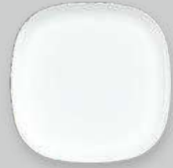
Prato quadrado Square plate Plato cuadrado Assiette carre 26x26cm # 011001600001