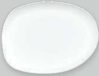
Prato grande Large plate Plato grande Assiette large 32x24cm # 011000300001