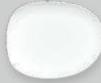
Prato pequeno Small plate Plato pequeno Assiette petite 22x18cm # 011003500001