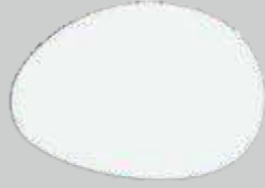
Prato sushi Sushi plate Plato sushi Assiette sushi 27x18cm # 011000400001