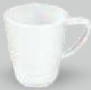
Caneca Mug Mug Mug 390ml # 063024600001 U 12 347g A 4164g 0,0160m 3