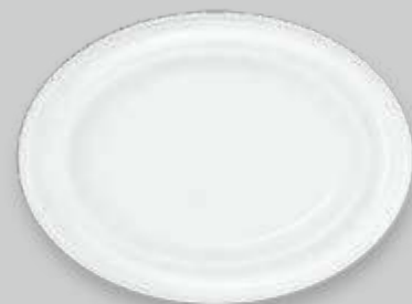
Prato oval Oval plate Plato Oval Assiette ovale 38x28cm # 063004500001