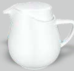
Bule Tea pot Tetera Theiere 1000ml # 063013000001 U 1 900g A 900g 0,0106m 3