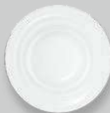
Prato fundo Deep plate Plato hondo Assiette creuse 23cm # 063002500001