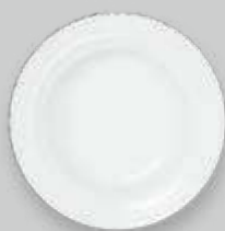
Prato Plate Plato Assiette 21cm # 063003000001