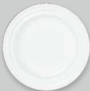
Prato Plate Plato Assiette 32cm # 063000300001