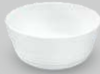
Saladeira serving bowl Ensaladera Saladier 19cm/1600ml # 063008500001 U 2 713g A 1426g 0,0048m 3