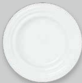
Prato Plate Plato Assiette 28cm # 063001000001