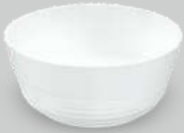
Saladeira Serving bowl Ensaladera Saladier 25cm/3700ml # 063008000001 U 2 1451g A 2902g 0,0114m 3