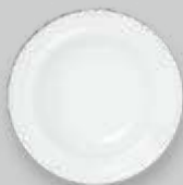
Prato Plate Plato Assiette 17cm # 063004000001