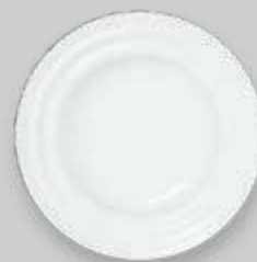
Prato Plate Plato Assiette 24cm # 063002000001