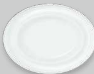
Prato oval Oval plate Plato Oval Assiette ovale 32x24cm # 063005000001