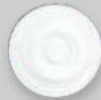
Pires saucer Platillo Soustasse 14cm # 063020200001 U 12 174g A 2088g 0,0030m 3