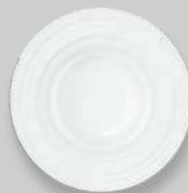
Prato fundo Deep plate Plato hondo Assiette creuse 28cm # 063000600001