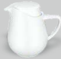
Bule Deep gourmet Plato gourmet Assiette creuse 550ml # 063014000001 U 1 450g A 450g 0,0048m 3