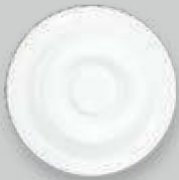
Pires saucer Platillo Soustasse 18cm # 063018200001 U 12 288g A 3456g 0,0048m 3