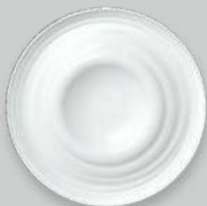
Prato wave Wave plate Plato wave Assiette wave 30cm # 063000500001